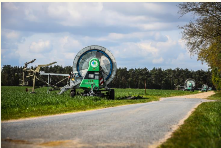
Figure 1: Points d'usage avec enrouleurs

Les eaux traitées valorisées en irrigation agricole sont traitées par la STEP de Braunschweig (360 000 EH) à travers des étapes de traitement physico-chimique et biologique. Ces eaux répondent aux standards allemands pour l'eau d'irrigation à destination de plantes biomasses énergie et de denrées destinées à être transformées. Ces types de cultures ne possédant aucun seuils concernant les paramètres microbiologiques. Après traitement, les eaux traitées sont acheminées via un réseau gravitaire vers 4 stations de pompage au sein des parcelles du AV-BS. L'eau traitée est ensuite transférée vers les systèmes d'irrigation grâce à un réseau pressurisé. L'irrigation est ensuite réalisée grâce à des enrouleurs et des canons d'aspersions. Chacun d'entre eux peut couvrir une superficie de 3 000 à 5 000 m 2 . L'ensemble du réseau a une longueur de 130 km et délivre de l'eau traitée à 1350 points d'usage. Cette région est particulièrement propice à l'irrigation intensive compte tenu de ses caractéristiques météorologique (déficit climatique), topographique (territoire plat) et de son type de sol (très sableux).