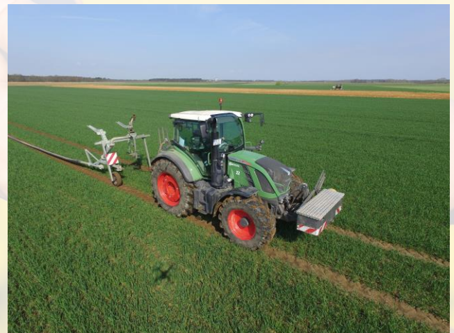
Figure 2: Tracteur tirant des asperseurs