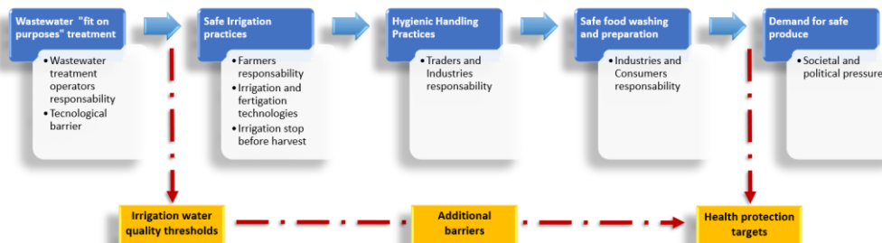
Figure 1: Approche à barrières multiples pour la qualité des eaux

La qualité de l'eau est un concept très relatif qui influence considérablement son adéquation à un usage particulier ou son impact sur les sols, les équipements d'irrigation et la rentabilité des cultures. La qualité doit garantir une protection efficace pour la santé humaine, l'environnement et l'agriculture, en plus de répondre aux exigences de l'utilisateur. C'est d'autant plus le cas lorsqu'il s'agit de réutilisation des eaux, où les normes de qualité de l'eau doivent être fixées sur la base de critères d'adéquation à l'usage. L'évaluation des exigences minimales de qualité des eaux pour leur réutilisation doit être basée sur une analyse de risque spécifique pour chaque cas. Les principaux éléments de cette analyse des risques sont les suivants : i) technologie d'irrigation/fertirrigation utilisée et impact sur la fonctionnalité de l'équipement ; ii) caractéristiques du sol et impact sur la fertilité du sol ; iii) impact sur les cultures et les produits ; iv) impact sur l'hygiène alimentaire ; v) protection de la santé de l'opérateur. Une réutilisation sûre des eaux peut être garantie par une approche à barrières multiples.